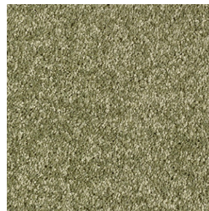
29 4m + 5m