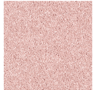
62 4m + 5m