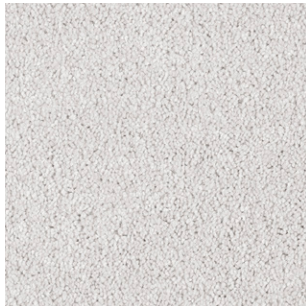
09 4m + 5m