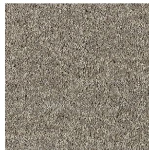
49 4m + 5m