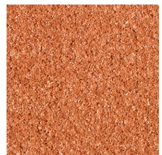
88 4m + 5m

The Associated Weavers Company reserves the right to modify the characteristics of this product while keeping the same technical properties. We strongly recommend the use of darker colours for heavy traffic areas.