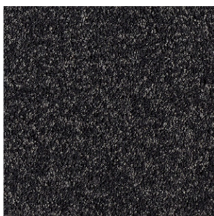
99 4m + 5m