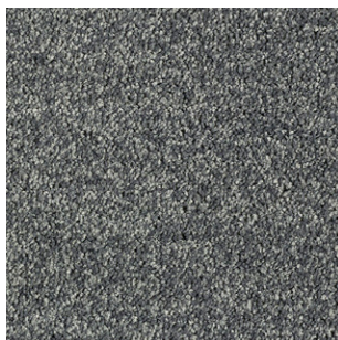
97 4m + 5m