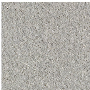
95 4m + 5m