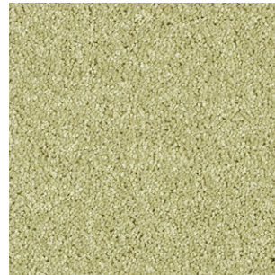
21 4m + 5m