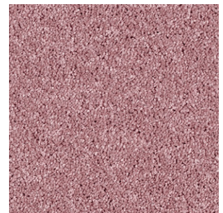
16 4m + 5m