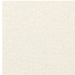
03 4m + 5m