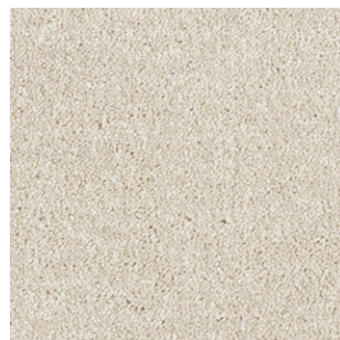
34 4m + 5m