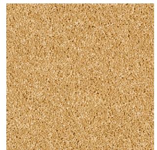
55 4m + 5m