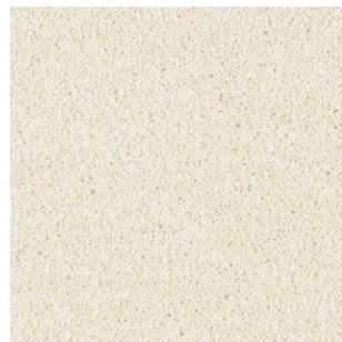
33 4m + 5m