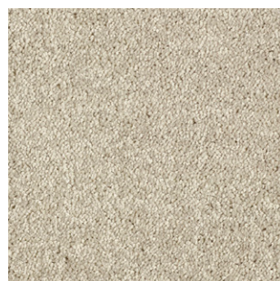
39 4m + 5m